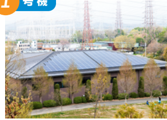
エコパーク21屋根上(北田原町) 2014年3月完成 太陽電池総容量 53.2kW