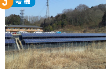
保健福祉ゾーン方面(小瀬町) 2016年2月完成 太陽電池総容量 56.0kW