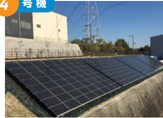
学研高山地区方面(高山町) 2017年12月完成 太陽電池総容量 85.0kW