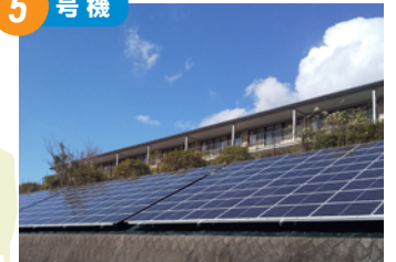
保健福祉ゾーン方面(小瀬町) 2021年11月完成 太陽電池総容量 90.0kW