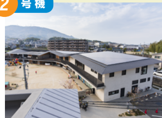
南こども園屋根上(小平尾町) 2016年3月完成 太陽電池総容量 57.9kW